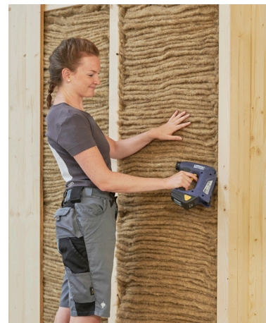
Die Dämmung wird „getackert“