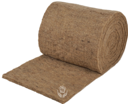
Schafwolldämmung in Rollen