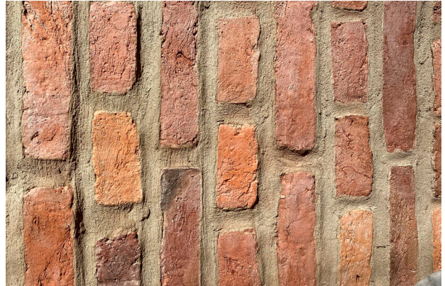
Pflasterung aus alten Ziegeln