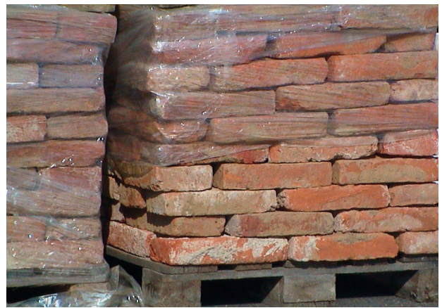
Lagerung zum Abtransport auf Paletten (max. 100 kg bzw. 250 bis 300 Stk)