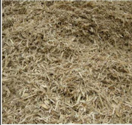
Recyclingholz Klasse B