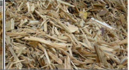
Recyclingholz Klasse C